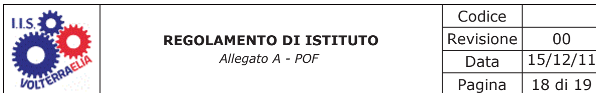
TABELLA A - VALUTAZIONE DELLA CONDOTTA